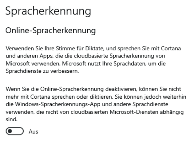
Abbildung 1 Konfiguration der Online-Spracherkennung (Windows 10, Version 1909)

Die Online-Spracherkennung kann, sofern das zugehörige Gruppenrichtlinien-Objekt dies zulässt, durch den Nutzer über die GUI unter Einstellungen|Datenschutz|Spracherkennung konfiguriert werden. In Abbildung 1 und Abbildung 2 sind die Einstellmöglichkeiten für die Versionen 1909 respektive 2004 dargestellt.